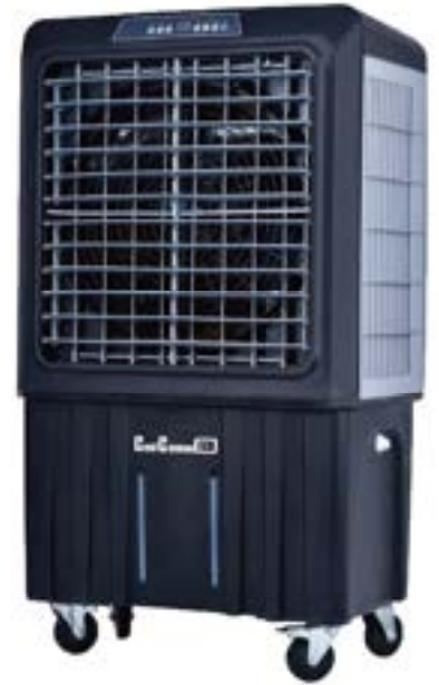
クールキャノンは登録商標です。