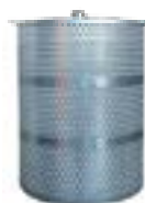
精密濾過ミニフィルター φ202x250L 型番：NSFS-5