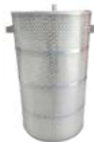
精密濾過フィルター φ300x500L 型番：NSF-5